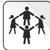
Capacidad 2 uds.