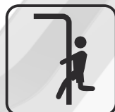
Barra de bomberos