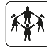
Capacidad 8-10 uds.