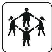
Capacidad 3 uds.