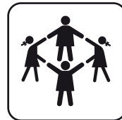
Capacidad 2 uds.