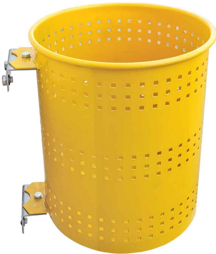
Detalle sujeción a la pared