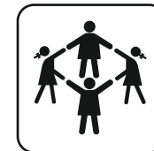
Capacidad 6-10 niños