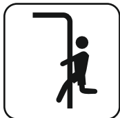
Barra de bomberos